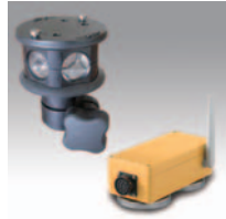
RS-2 SS無線 プリズムユニットA6MC