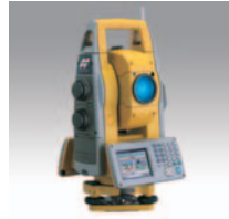
自動追尾パルス トータルステーション GPT-9000A MC EDITION