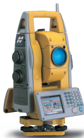
GPT-9000A MC EDITION LPS-900 トータルステーション マシンコントロールシステム