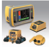
グレーダーセット