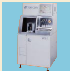
ウェーハ表面検査装置 WM-7

「工業用製品事業」は、中国で生産しているアナログコピー機用レンズユニットが低調に推移いたしました。国内においては、IT関連を中心とした設備投資の減少がありましたものの、液晶露光装置等の産業機器が伸長したことにより、売上高は75億7千1百万円(前年同期比4.6%増)となりました。営業利益は粗利の改善と諸費用の減少により5億1千6百万円(前年同期1億4千9百万円)と大幅な改善となりました。