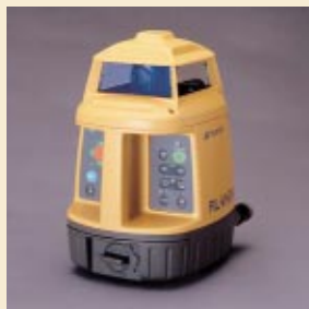
ローテーティングレーザー RL-VH3G/A

測量機器は、国内の厳しい事業環境の影響を受け減少しましたが、海外においてトータルステーション、GPS、マシンコントロールが順調に推移しました。