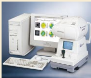
ウェーブフロントアナライザー KR-9000PW

ウェーブフロントアナライザー KR-9000PWは、現在世界的に普及しつつあるエキシマレーザーによる角膜屈折矯正手術への手術ガイドデータの提供により、人間の眼の収差を極限まで減少する“スーパーノーマルビジョン”の可能性を開く画期的な製品です。