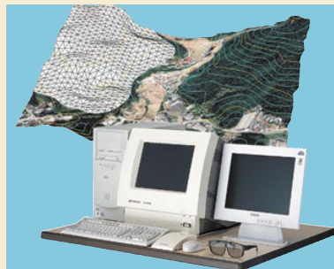
3D計測ステーション PI-2000