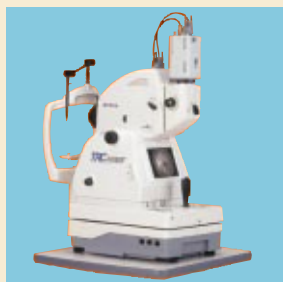
無散瞳眼底カメラ TRC-NW6SF

医用機器は、医科器械における遠隔診療等のネットワーク対応型システムのIMAGEnetが好評で順調に伸長しました。