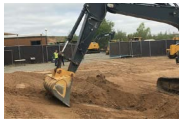
法面も設計データ通りに簡単に整形

3D-MG ショベルはマルチ GNSS 受信機による正確な位置把握により、杭打ちや出来形管理等の測量作業の軽減が可能です。より施工に集中でき、納期通りの作業が可能となります。