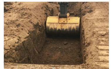
設計データに沿って掘削